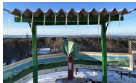
<2月18日の朝の展望台> (つららが分かるでしょうか?)

感染症の状況によっては開催の可否すら危惧されましたが、1年間の学習の集大成にふさわしい発表会になりました。潮見っ子はこの1年で着実に成長しました。