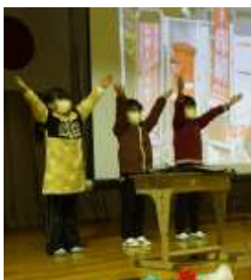
<2年生の発表の様子>