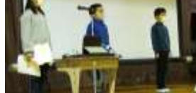
<中学年の発表の様子>