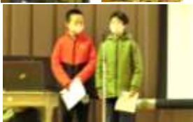
<高学年の発表の様子>