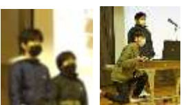
<中学年の発表の様子>