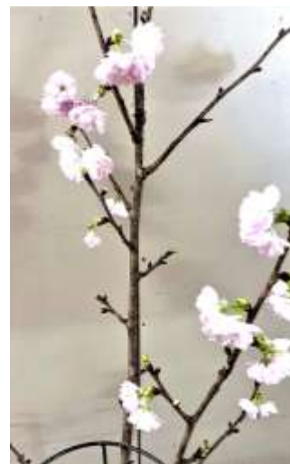
<校長室で花開いた花桃> 始業式の会場に飾りました

「笑顔」で「キラリと輝く」潮見っ子の姿を数多く引き出せるよう、全職員が一丸となって大切な大切な潮南の子どもたちを全力で育てて行きます。