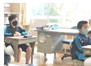
＜参観授業・高学年＞

保護者の皆様に学校に来校していただき、子どもと触れ合ったり、真剣に考える姿を直接見ていただいたり、新しいシステムを体験していただいたりとても有意義な時間を過ごすことができました。来校していただき本当によかったと思います。感染症を正しく恐れ、引き続き感染症対策を万全に行い、コロナ禍でも小規模校ならではの活動を今後も模索していきたいと思ひます。