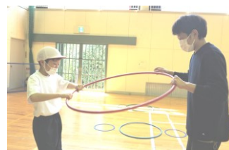
＜参観授業・中学年＞